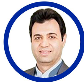
مدیر گروه DBA