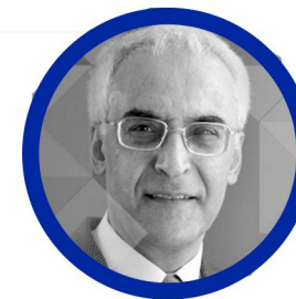
دکتر داریوش محجوبی